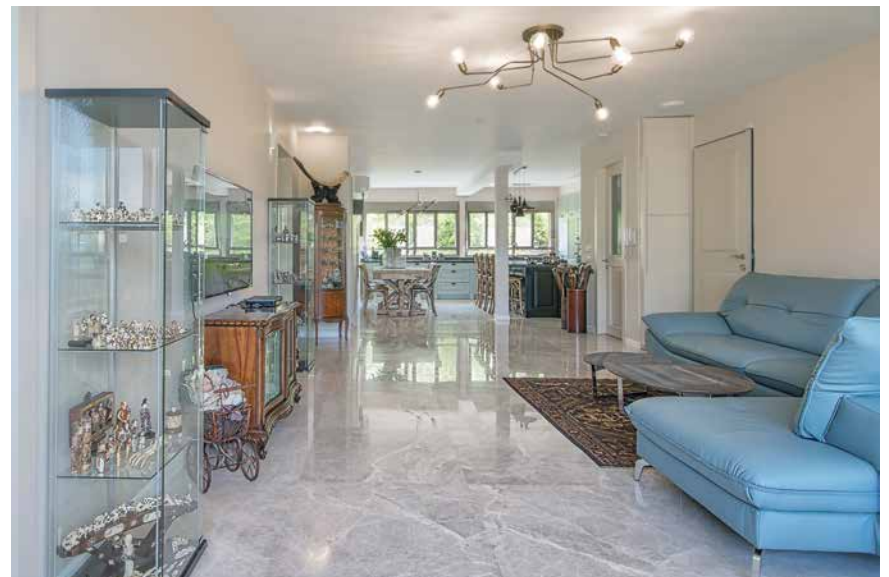
ספה בגוונים מודרניים. ספה: ביתילי

בחדרי השינה, הותאמה רצפת פרקט עשויה לוחות עץ עבים. בפני המעצבת עמדה אפשרות לבחור פרקט בדוגמה