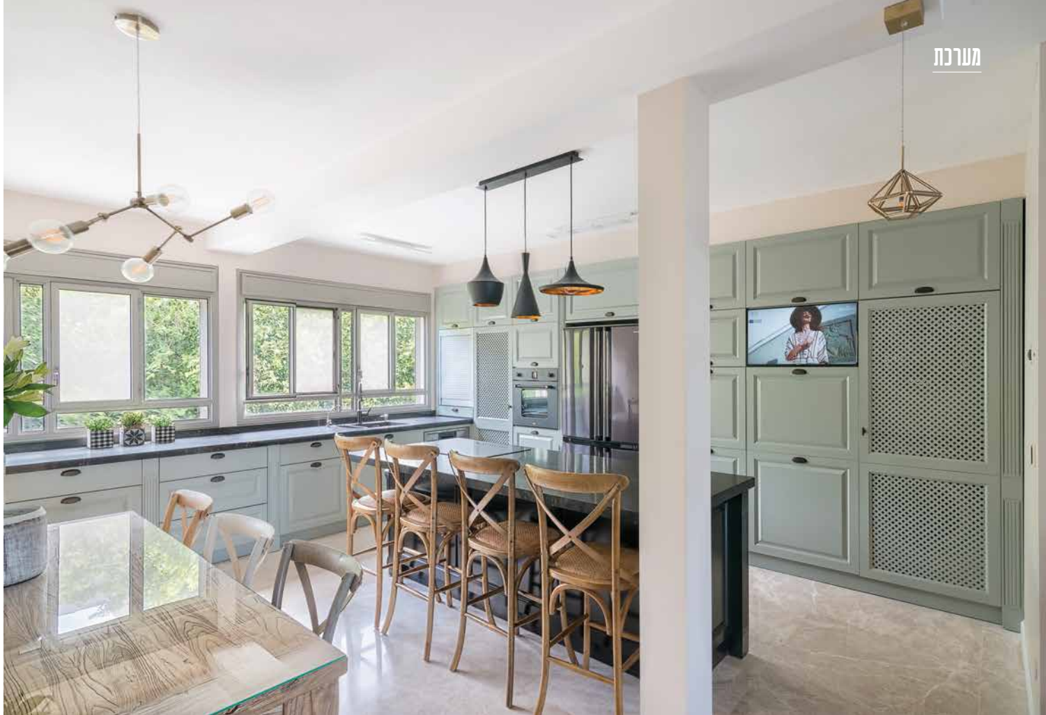
בארונות המטבח שולב צג טלוויזיה להנאת היושבים ליד דלפק האכילה. נגרות: חיים הנגר, תאורה: סוהו תאורה